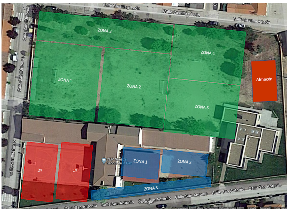
Diagrama para el uso de espacios de recreo

Las zonas de juego serán las que se indican en el diagrama. Habrá vallas portátiles para diferenciar cada zona, no acotándola, pero sí marcando claramente los límites.